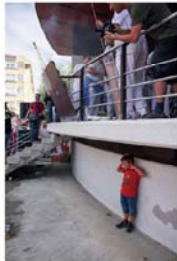
Estruendo inicial - (Hasierako danbada)