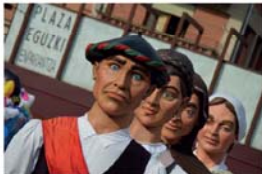
Begiradak - (Miradas)