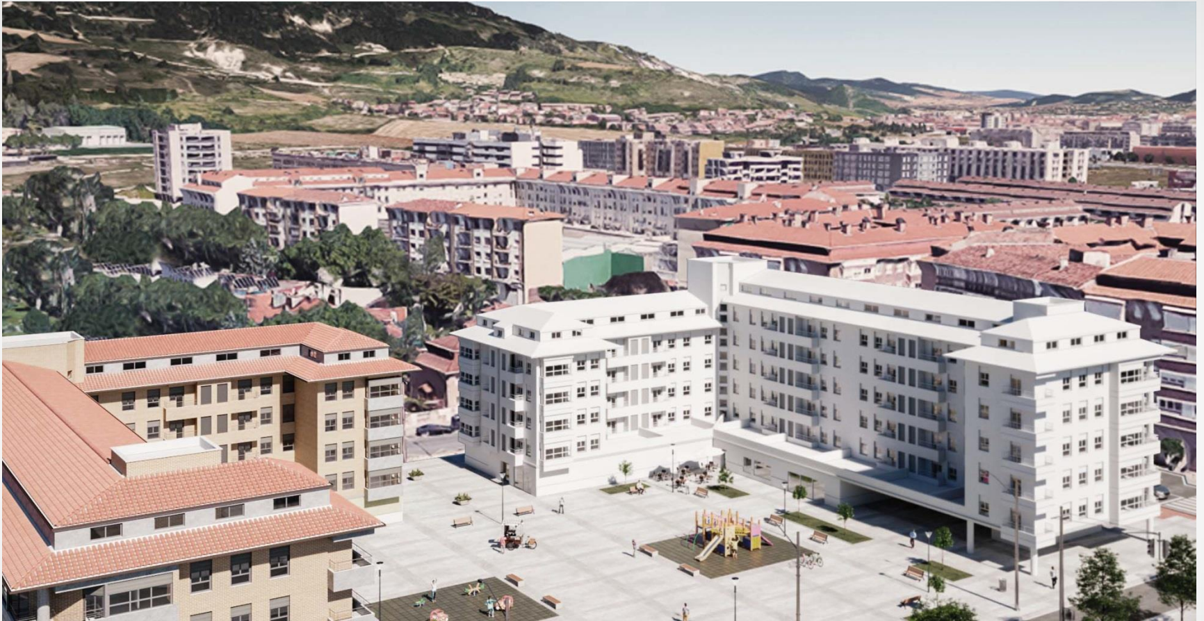
Proceso participativo PEAU Parcela 5 Unidad UR.1 de BERRIOZAR