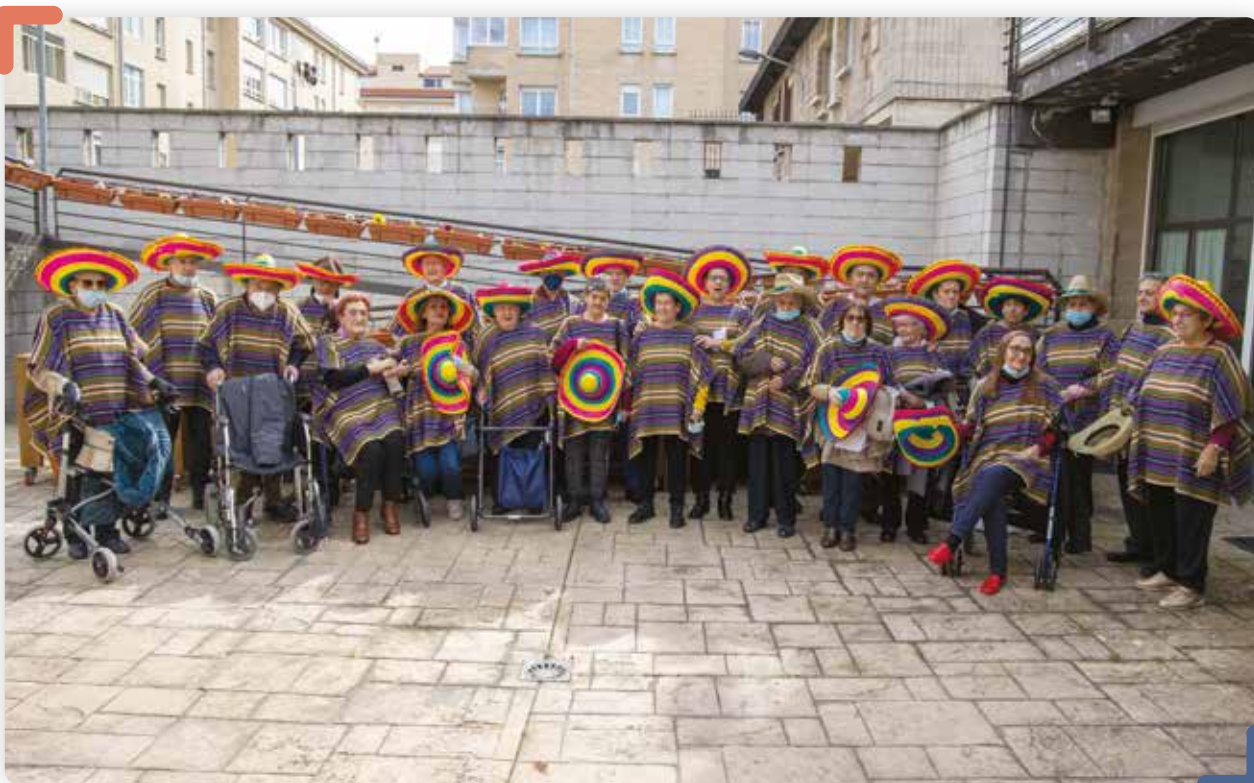
Autonomia eta Senitartekoen Atsedena Sustatzeko Programa, 2022ko inauteriak ospatzen